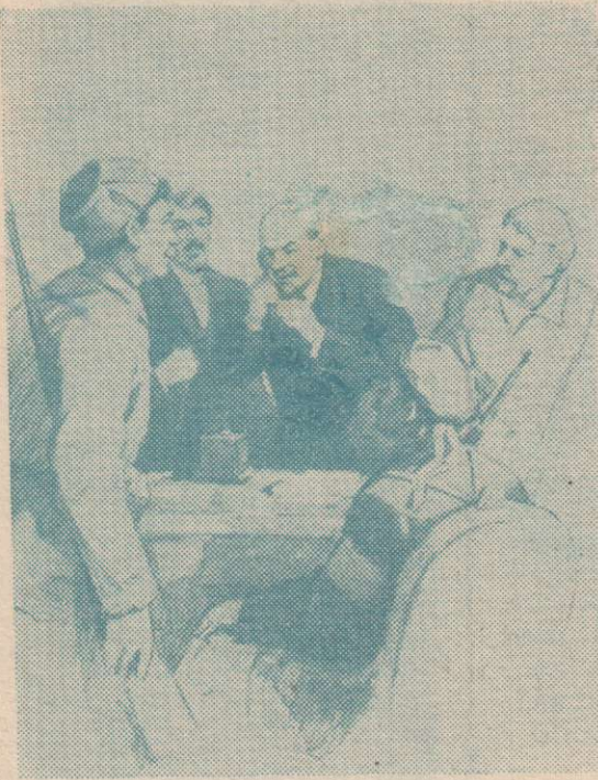
В. И. Ленин у телефона в Смольном.