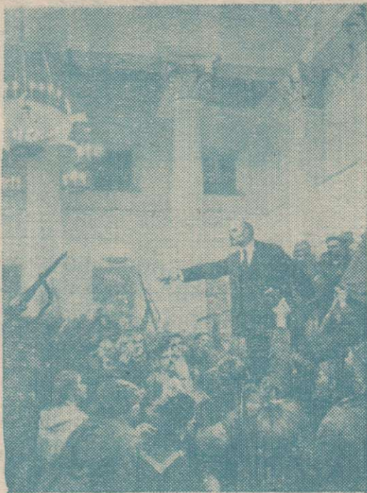
В. И. Ленин провозглашает Советскую власть (с картины художника В. Серова).