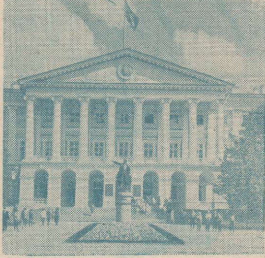
Ленинград сегодня. Смольный — штаб Великого Октября. Здесь находились Военно-революционный комитет и ЦК партии большевиков, занимавшиеся подготовкой и проведением вооруженного восстания. Сюда 24 октября вечером для непосредственного руководства восстанием прибыл В. И. Ленин.